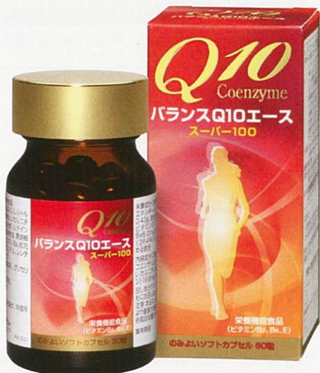
のみよいソフトカプセル